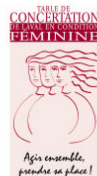
Table de concertation de Laval en condition féminine