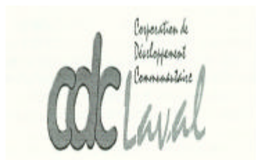
Corporation de développement communautaire de Laval